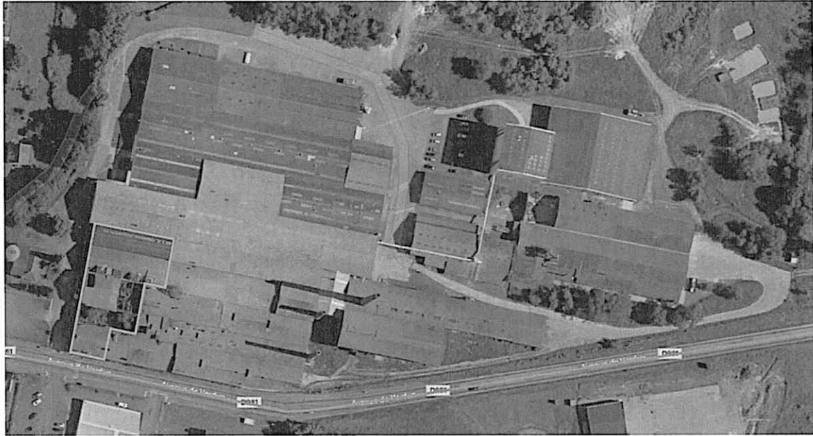
Bâtiments proposés à l'achat