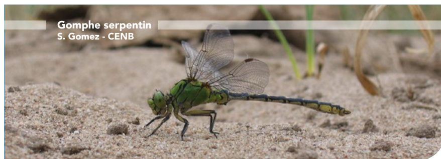
Gomphe serpentin S. Gomez - CENB

L'établissement d'un Comité consultatif de gestion, réunissant experts, acteurs locaux et propriétaires, et l'élaboration d'un Plan de gestion sur 10 ans pour la Réserve naturelle régionale constituent un préalable à la mise en œuvre d'actions de gestion.