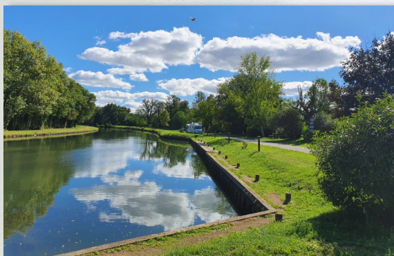
Vue depuis la Halte Nautique