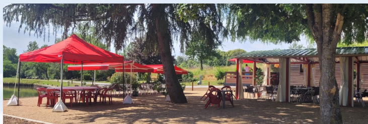
Terrasse de la Halte Nautique