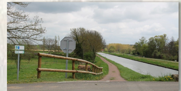
Canal latéral à la Loire

D - 200 mètres avant le pont, prendre à droite, longer le ruisseau et revenir au point de départ.